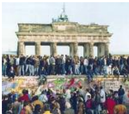
Festeggiamenti per la riunificazione

A lla fine della seconda guerra mondiale, che vide la Germania soccombere, gli accordi presi tra i Paesi vincitori stabilirono la divisione della Germania in due settori controllati ad ovest dalla Francia, dall'Inghilterra e dagli Stati