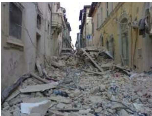
Gli ingenti danni provocati dal terremoto in Abruzzo

Però, e qui scappa un sorrisino, la escort (o