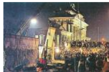
Le gru iniziano l'abbattimento del "Muro"

Il mondo libero ha sconfitto Nazismo, Fascismo e Comuni-