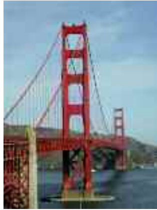
Golden Gate Bridge a San Francisco

Comoda alternativa alle gambe è il "Cable Car", un particolare tram aperto, romantico testimone del passato. Il suo movimento è dato da un cavo sotterraneo che viaggia alla velocità costante di nove miglia all'ora, questo sistema fu inventato per avere un veicolo in grado di arrampicarsi lungo le colline della città. Ci sono anche i classici tram che arrivano un po' da tutto il mondo, anche da Milano; sono molto vecchi, ma riparati e ridipinti a San Francisco comincia-