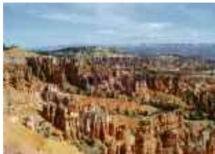
Bryce National Park

ter ai 1.600 metri di Dante's View con la magnifica vista dell'intera vallata, ed alle rocce "lunari" di Zabriskie Point dove è stato girato il famoso film di Michelangelo Antonioni.