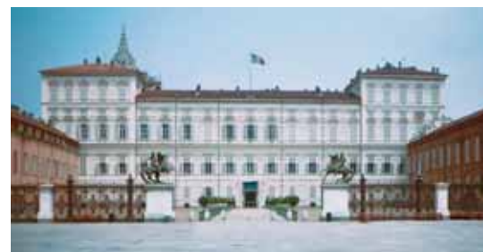
Palazzo Reale da piazza Castello

Alla fine dell'800 iniziò una grande trasformazione industriale della città, con il miglioramento dei collegamenti ferroviari, dell'assistenza e dell'istru-