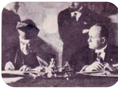
La firma dei Patti Lateranensi

contrastanti e giungere ad una pacifica coesistenza delle due potestà. La "ferita", già considerata insanabile dalla Santa Sede, fu, con il passare del tempo, dapprima tollerata, di poi accettata, infine sanata con la firma dei Patti Lateranensi. I punti salienti dei Patti fra Stato Italiano e Vaticano furono un "trattato politico" ed un "concordato ecclesiastico". Con il primo: si abrogò la legge delle guarentigie del 1871; si creò il nuovo Stato della Città del Vaticano, con sovrano il Sommo Pontefice; si sancì il riconoscimento reciproco; si stabilì la condizione giuridica di neutralità ed inviolabilità del Vaticano; si riconobbe il pieno possesso di tutte le proprietà immobiliari con relative attinenze e dipendenze, tra cui le basiliche patriarcali di San Giovanni in Laterano, Santa Maria Maggiore e San Paolo nonché il palazzo pontificio di Castel Gandolfo; si garantì l'immunità diplomatica sugli immobili