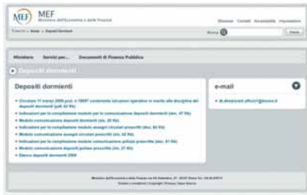
La pagina sul sito del Ministero dell'economia e delle finanze sui conti dormienti

Si tratta di numeri da capogiro quelli che interessano le Poste italiane sul fronte dei conti dormienti, le norme coinvolgono i