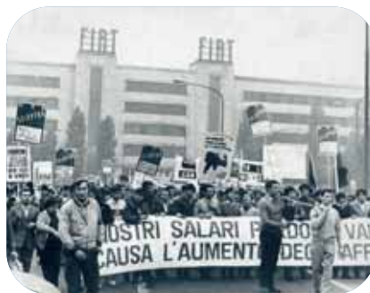
Uno sciopero nei stabilimenti Fiat Mirafiori nell'autunno del 1969

zione di privilegio della Fiat poté durare sino a quando l'apertura delle frontiere mise la grande azienda torinese in concorrenza con colossi internazionali come Renault e Volkswagen.