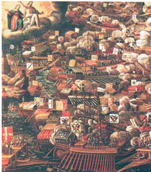
La battaglia di Lepanto rappresentata in un quadro di Scuola Veneziana (particolare)

Maometto in una organizzazione statale e religiosa molto coesa. Maometto, nato nel 570 e morto proprio nel 632, fu il fondatore della religione musulmana e dello Stato musulmano. Rimasto orfano in tenera età, fu adottato da uno zio paterno, e a causa della ristrettezza economica della famiglia visse un'adolescenza di stenti. Il matrimonio con