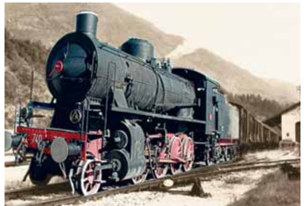
Locomotiva a vapore "gruppo 740"

bordi della vasca piena d'acqua ma priva di pesci, della piccola stazione di periferia, con solo due binari e qualche carro arrugginito, ma nella sua modestia, sempre armoniosa e piena di vita. E come potrò mai dimenticare il vecchio e dinoccolato Capo Stazione, nell'elegante uniforme a doppio petto di colore grigio scuro tigrato. Tigrato a causa della cenere, delle sue puzzolenti sigarette, che gli gocciolava addosso e che lui con fare sbrigativo faceva scivolare a terra, con il dorso della mano. Me lo vedo ancora seduto sull'uscio del suo uf-