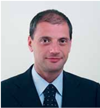
L'Onorevole Alberto Giorgetti

La nota in questione evidenzia come solo il nostro Sindacato si batte per portare a soluzione il diritto ai benefici economici derivanti dalle vigenze contrattuali tra il 1981 ed il 1995. Una delegazione del S.a.pens. ha incontrato nei giorni scorsi il Sottosegretario all'Economia ed alle Finanze On. Alberto Giorgetti, l'occasione è stata utile per la consegna di un corposo fascicolo contenente tutta la documentazione inerente