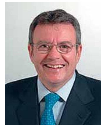
Il Senatore Piergiorgio Massidda

1. La presente legge entra in vigore il giorno successivo a quello della sua pubblicazione nella Gazzetta Ufficiale .