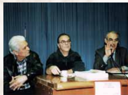
Il segretario generale con la delegazione dei pensionati francese

Sud Rail propose qu'à l'issue de ce Congrès, se crée rapidement un groupe de travail entre nos organisations respectives pour: