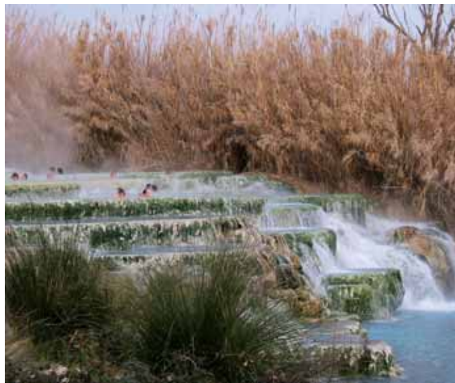
Le terme di Saturnia

a mio avviso, dei più belli è quello del Monte Amiata: conosciuto sin dai tempi degli Etruschi, si trova nel sud della Toscana e costituisce una delle tante attrattive di questa bella regione. L'Amiata in realtà non è una montagna ma un antico vulcano ormai estinto ricoperto da una verdeggianti campagna e boschi rigogliosi, costellato da borghi medievali ricchi di storia. Di questa zona SATURNIA , nel Grossetano, costituisce il centro forse più conosciuto anche all'estero. L'acqua ter-